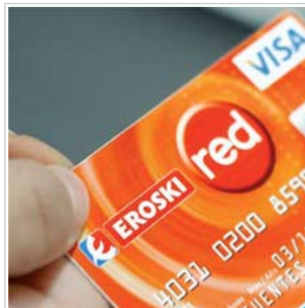
Familiako ekonomiaren administrazio

Perfumerías If lurrindegietako txartela. Horrez gain, gure Perfumerías If lurrindegietako bezeroek beren txartela dute; horri esker, beharpen handiekin batera, abantaila komertzial handiak jaso ahalko dituzte (%10eko beharpena gama altuetan eta eskaintza bereziak mass market