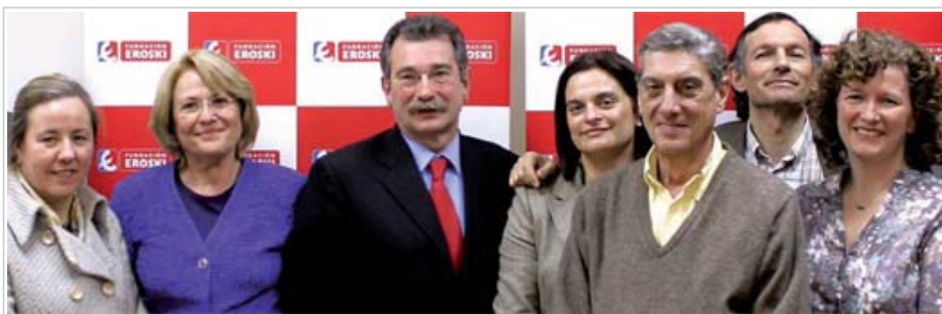
Garapenerako Nazioarteko Lankidetzaren VI. deialdiak ondorengo proiektuak finantzatu zituen: Beninekin Elkartasun Elkarteak, Afrika Zuzenean Fundazioa, eta Ekologia eta Garapena Fundazioa

Azken edizioan, berriz, lagundutako proiektuak hauexek izan ziren: Beninekiko Elkartasun Elkarteak aurkeztutakoa, Bemberekeko landa eremuan hiru herrixka eraikitzean zetzana, Karité-a (intxaurren antzeko produktu naturala, elikagai eta agente hidratatzailetan oso aberatsa) eraldatzeko kooperatibak ezartzeko. Ekimen honen helburua da genero arteko berdintasuna bultzatzea eta parte hartzen duten emakumeen autonomia lortzea. Karité-a produktu erdilandu bihurtzeko eraldaketak lau aldiz biderkatzen du bere salneurria.